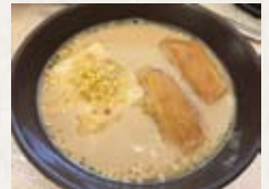
スーテーチェ (モンゴル風ミルクティー)